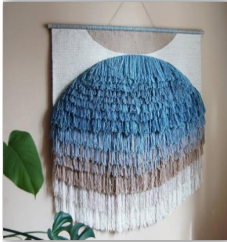
Görsel 14: Dokuma duvar halısı (Mail yolu ile yapılan yazışmalar ile sanatçının arşivinden alınmıştır).

Irene Musina tarafından tasarlanan ve uygulanan “Cosmic” isimli çalışmada dokuma tekniği kullanılarak bir duvar halısıdır (Görsel 14).