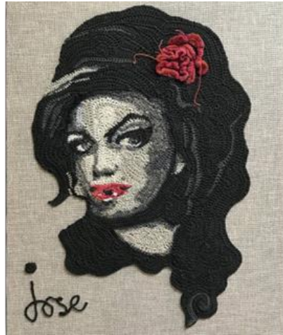
Görsel 3: Örgü Amy Winehouse portresi (Mail yolu ile yapılan yazışmalar ile sanatçının arşivinden alınmıştır).

Jose Dammers tarafından yapılan "Amy Winehouse" isimli çalışmasını örgü / serbest biçimli kroşe tekniği ile yapılmış bir portre çalışmasıdır (Görsel 3).