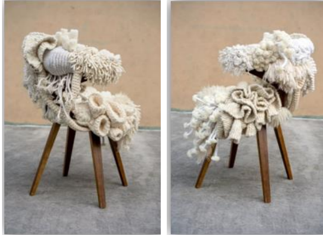
Görsel 5,6: Sandalye kaplama çalışmasının sağ ve sol görseli.

Erik Speer tarafından tasarlanan ve uygulanan sandalye kaplama örgü, düğüm, dokuma, kroşe, dikiş, ciltleme teknikleri kullanılarak yapılmıştır. (Görsel 5,6).