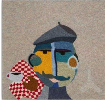
Görsel 13: Örgü tablo / French Monsieur ( https://signeriisom.dk/ )

Signe Riisom tarafından tasarlanan ve uygulanan “French Monsieur” isimli çalışması örgü tekniği ile yapılmış bir tablodur ( Görsel 13).