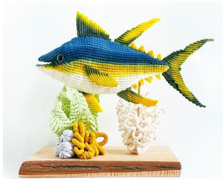
Görsel 1: Tuna Sculpture

Kasha Cantillo tarafından tasarlanıp uygulanan “Tuna Sculpture/Fiber Sculpture Fish” isimli bu çalışma, makrome/ düğüm tekniği ile yapılmış lif heykelidir (Görsel 1).