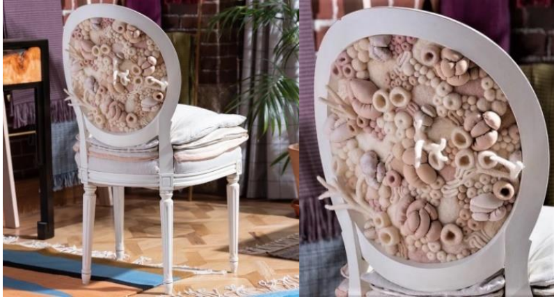
Görsel 11.12: Keçe sandalye kaplama / Tide Pool Cabriolet (Mail yolu ile yapılan yazışmalar ile sanatçının arşivinden alınmıştır).