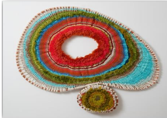
Görsel 9: Dokuma duvar panosu / Blue Halo (Mail yolu ile yapılan yazışmalar ile sanatçının arşivinden alınmıştır).

Tammy Kanat tarafından tasarlanan ve uygulanan "Blue Halo" isimli çalışma dokuma tekniği ile yapılmış bir duvar panosudur (Görsel 9).