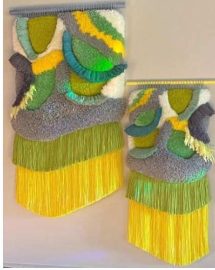
Görsel 4: Duvar Halısı

Judit Just tarafından tasarlanan ve uygulanan “Gigantic Landscape 10” isimli çalışma dokuma / halı tekniği ile yapılmış bir duvar halısıdır (Görsel 4).