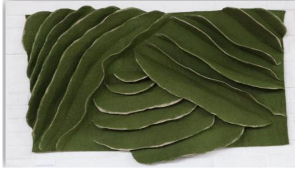
Görsel 7: Keçe duvar panosu (Mail yolu ile yapılan yazışmalar ile sanatçının arşivinden alınmıştır).

Kırmızı, mavi, yeşil, pembe, sarı, kahverengi renkleri ile yapılan çalışmada malzeme olarak kuzu yünü kullanılmıştır. Kalp şeklindeki çalışmanın boyutları genişliği: 30 cm, yüksekliği: 30 cm'dir (Jenkins, 2020). Mutfak dekorasyonu için tasarlanan çalışmadaki tüm parçalar kalp şeklinde birleştirilerek kullanılmıştır.