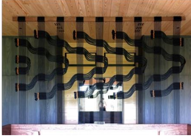
Görsel 10: Separatör / Lava Flow (Mail yolu ile yapılan yazışmalar ile sanatçının arşivinden alınmıştır).

Windy Chien tarafından tasarlanan ve uygulanan “Lava Flow” isimli çalışma macrome ve sarma tekniği kullanılarak yapılmış bir separatördür (Görsel 10).